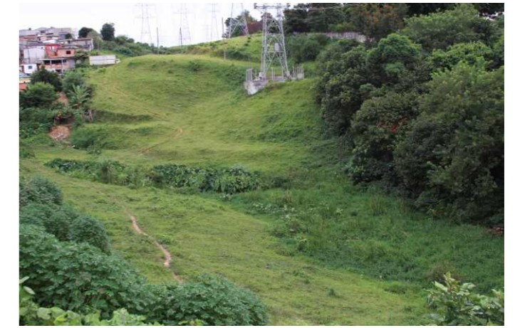
Figura 4. Ambiente onde foi observado um exemplar de Furnarius figulus em Osasco, SP.

A Gilberto Correa Lima, pela companhia em algumas das excursões para observação da espécie e cessão de documentação visual. A Emerson Panis Kaseker e Caio Lima, pela criação do mapa.