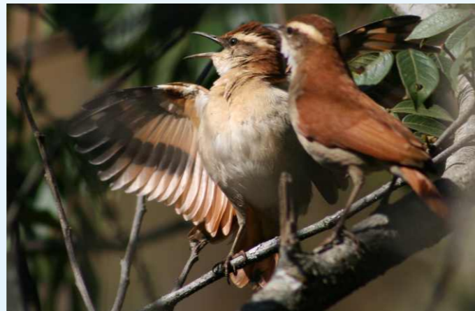
Figura 2. Furnarius figulus . Parque Estadual Juqueri, Franco da Rocha, SP.

Presume-se que sua chegada ao Parque Estadual do Juquery tenha se dado a jusante do rio Juqueri (afluente do rio Tietê), tendo seguido por suas várzeas e áreas contíguas. Teria chegado a este rio a partir do vale do Paraíba, atingindo, desta forma, o vale do rio Tietê. É desejável a busca da espécie nessas áreas intermediárias ao longo do rio Juqueri, a montante do Parque Estadual do Juquery, visando verificar a rota de dispersão da espécie nessa região. Da mesma forma, sua procura nos varjões e áreas de horticultura no alto rio Tietê, onde poderá aparecer proveniente de Arujá e outras áreas do rio Paraíba. Com relação à localidade de Osas-