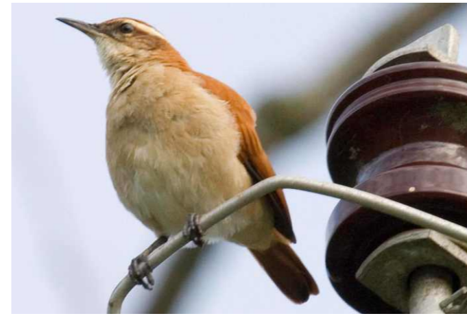
Figura 3. Furnarius figulus . Bertioga, SP.

co, é interessante procurá-la ao longo da faixa de transmissão de linha elétrica, proveniente da represa Edgar de Souza, em Santana do Parnaíba, que está próxima do baixo rio Juqueri. No litoral, é esperado que a espécie ocorra na região entre Ubatuba e Bertioga, e é recomendável a sua procura mais ao sul, onde já pode ter chegado. A localidade do registro em Santo André, em plena área urbana, isolada de outras áreas propícias à espécie, mostra que a espécie deve deslocar-se por razoáveis distâncias, em busca de seu ambiente preferencial.