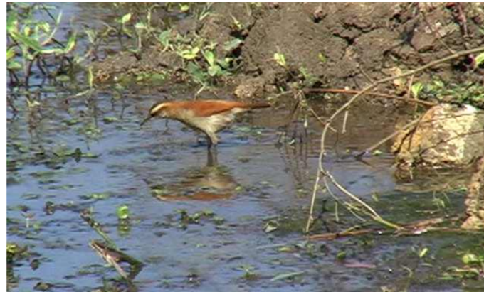
Figura 1. Furnarius figulus forrageando dentro de um canal de irrigação. Chácara em Arujá, SP.

Em 14/3/2010 LFAF observou e gravou a voz de um exemplar numa faixa de transmissão de rede elétrica ao lado do Cemitério